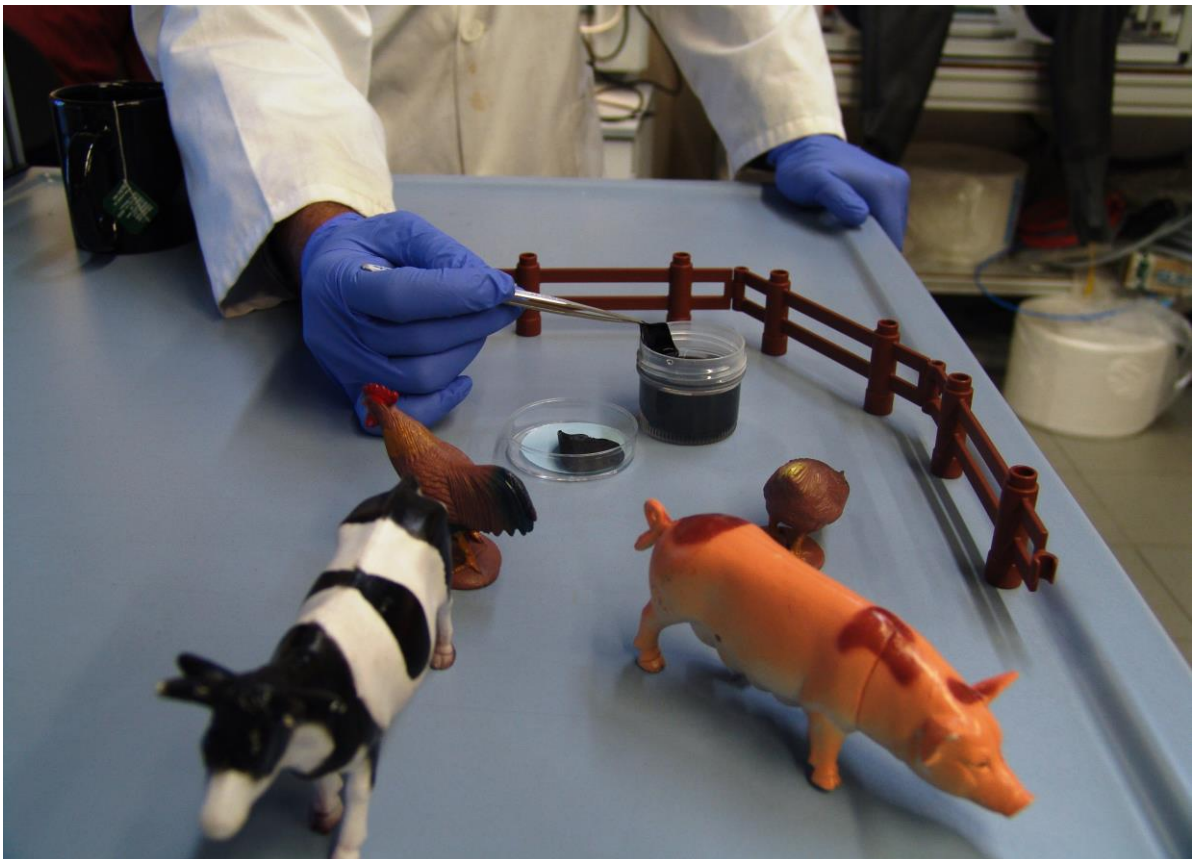
Thermoelectric paper is produced in the lab by bacteria

Roig claims that, in comparison to other similar materials, "this one has a higher thermal stability compared to other thermoelectric materials based on synthetic polymers, which allows it to reach temperatures of 250 °C. In addition, the device does not use toxic elements, and the cellulose can easily be recycled, since it can be degraded by an enzymatic process converting it into glucose, while recovering the carbon nanotubes, which are the most expensive element of the device". Moreover, the thickness, color and transparency of the material can be controlled.